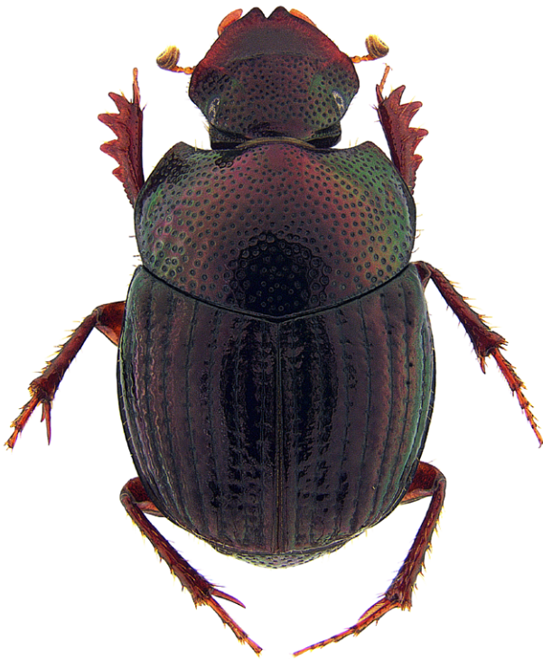
Figura 1. Hábito dorsal de la hembra de Onthophagus chinantecus .

dorsal negra brillante, con reflejos rojos y verdes. Cabeza: superficie glabra. Clípeo fuertemente bisinuado, con puntos transversales impresos superficialmente. Carina clipeal elevada, volviéndose inaparente hacia las genas. Superficie de la frente plana, con puntos ocelados profundamente impresos. Carina frontal ausente. Suturas genoclipeales débilmente impresas. Puntuación de las genas similar a la puntuación de la frente. Pronoto: superficie glabra, sin proyecciones o tubérculos. Puntuación pronotal profundamente impresa, irregular en tamaño y ocelada. Fóveas laterales inconspicuas. Microescultura lisa. Élitros: estrías elitrales profundamente impresas, con puntos profundos y ocelados espaciados regularmente. Interestrías con puntuación débilmente impresa y simple (no ocelada). El ápice de las interestrías con sedas inconspicuas, escasas y dispersas; excepto en la interestría más extensa, que posee sedas en toda su superficie. Microescultura lisa. Pigidio: puntuación profundamente impresa, ocelada y espaciada regularmente. Sedas inconspicuas, escasas y dispersas. Microescultura lisa. Patas: protibia cuadridentada en el borde externo, de apariencia ancha, con proyecciones ausentes en el borde interno y el ápice. Meso y metafémures bicolorés. Vagina (fig. 4): porción ventral esclerosada, con forma de una banda delgada, que se curva hacia arriba en los extremos laterales.