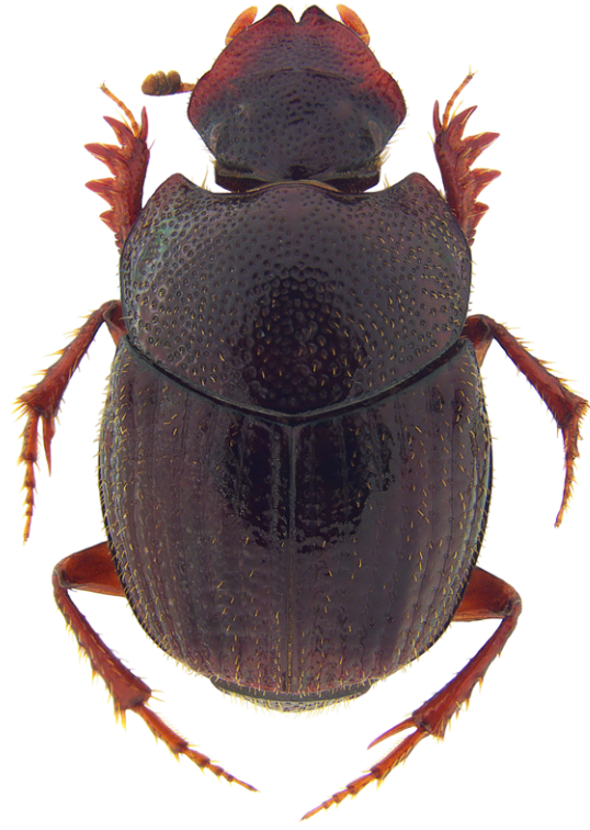
Figura 3. Hábito dorsal de la hembra de Onthophagus asperodorsatus .