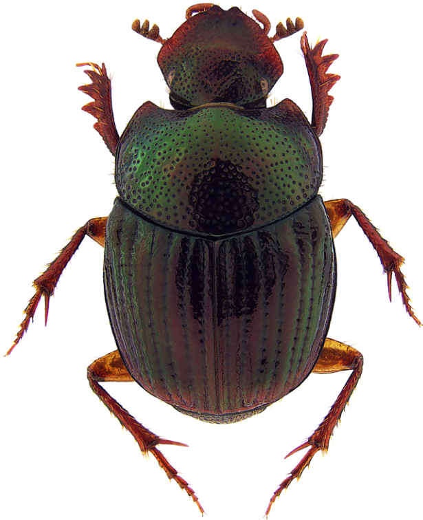
Figura 2. Hábito dorsal de la hembra de Onthophagus petenensis .

Onthophagus chinantecus se puede separar fácilmente de las especies cercanamente relacionadas O. petenensis y O. asperodorsatus . Onthophagus chinantecus y O. asperodorsatus poseen una carina clipeal elevada (figs. 1, 3), mientras que O. petenensis carece de quilla clipeal