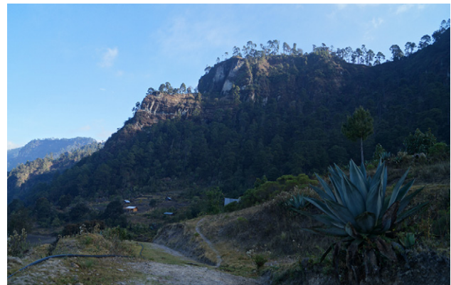
Figura 5. Hábitat de Echeveria andreae J. Reyes y L.E. Cruz-López, en bosque de Pinus-Quercus de la localidad tipo.

Facultad de Arquitectura de la Universidad Nacional Autónoma de México, quien ubicó por primera ocasión la localidad tipo de la nueva especie y por su interés en el rescate y conservación de plantas, especialmente de Chiranthodendron pentadactylon Larreat., y de las especies utilizadas en los jardines prehispánicos.