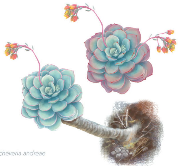
Figura 1. Echeveria andreae J. Reyes y L.E. Cruz-López. Hábito, rosetas e inflorescencias. Ilustración de Ariadna Arenas.

Planta herbácea, perenne, glabra, solitaria. Raíz primaria tuberosa, las secundarias fibrosas. Tallos erectos a decumbentes, tortuosos, eramosos, gris plumizos, hasta 70 cm de longitud, 1.3-2.5 cm de diámetro. Roseta laxa, 7-13 cm de diámetro, hojas de 4-9 cm de largo, 2.5-4 cm de ancho en la parte más amplia, espatuladas a orbicular-espatuladas, base amplexicaule, glaucas, pruinosas, crasas, margen entero y rojizo, ápice obtuso, mucronulado. Tallo floral erecto a ligeramente reclinado y tortuoso, rosa intenso, 1-3 por roseta, 6-20 cm de longitud